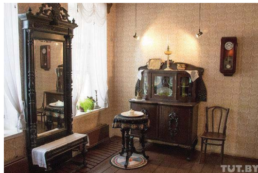
Рисунок 8 – Фрагмент экспозиции в музее Марка Шагала.

века и, конечно же, творчестве Марка Шагала. В планах — открытие библиотеки, чтобы сделать книги доступными для широкого круга читателей [11].