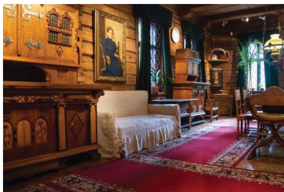
Рисунок 5 – Интерьер дома-музея В. М. Васнецова

Помимо непосредственно экспонатов (по приблизительным подсчётам более 24 тысяч), являющихся результатами творчества художника, особое внимание уделено и интерьерному наполнению музея, посетитель переносится в атмосферу жизни конца 19 века (рисунок 5).