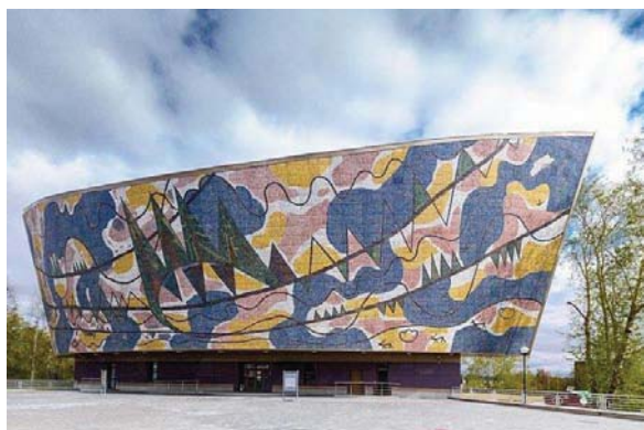
Рисунок 6 – Фасад галереи-мастерской художника Г. С. Райшева