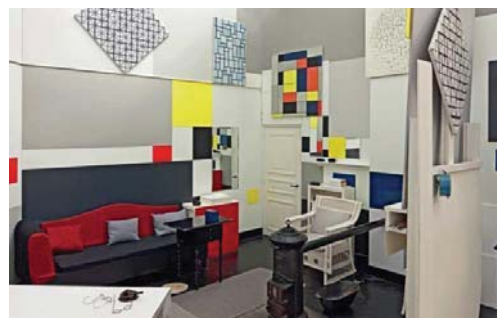
Рисунок 3 – Фрагмент экспозиции дома-музея Питера Мондриана

В Мондриана находится реконструкция парижской студии-ателье художника, где он прожил с 1919 по 1938 годы. Его трубка и очки того периода были запечатлены на минималистских фотографиях Андре Кертеса, ставших эмблемными для современного фотоискусства. В музее представлены его абстрактно-симметричные картины, а также результаты влияния идей художника на архитектуру, живопись, промышленный дизайн и прочее (рисунок 3).