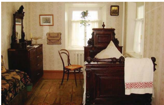
Рисунок 4 – Жилая комната Ивана Шишкина

Дом-музей Ивана Ивановича Шишкина. Большая гостиная занимает доминирующее положение в доме. Она обставлена подлинной мебелью красного дерева 30-40-х годов XIX века. На стенах развешаны картины друзей художника: В. Рязанова, А. Гине, П. Верещагина, А. Киселева. В малой гостиной проводили досуг жильцы дома, в ней сохранен и передан дух «той» жизни, окружавшей и наполнявшей художника.