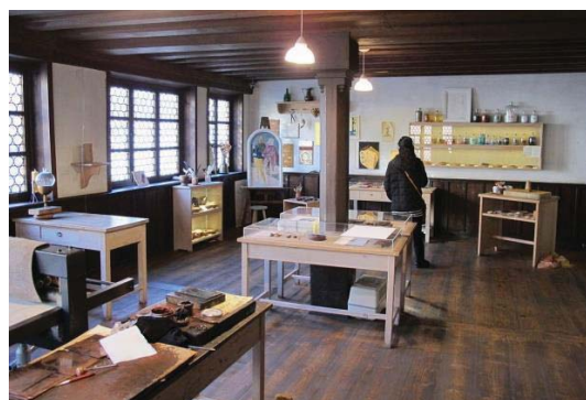
Рисунок 2 – Кухня дома-музея Альбрехта Дюрера

техниках, в которых Дюрер считался непревзойденным мастером [4].