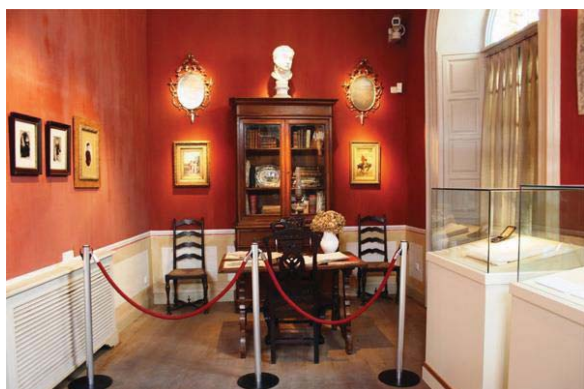
Рисунок 1 – Экспозиция дома-музея Пабло Пикассо

Дом-музей Пабло Пикассо в Малаге. При его посещении можно изучить мастерскую, в которой трудился художник, увидеть личные вещи не только Пабло, но и его семьи. Во внутреннем пространстве дома представлено более двухсот работ Пикассо – рисунки, графика, скульптура и керамика (рисунок 1).