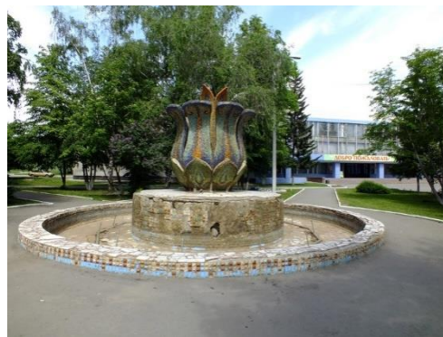
Рисунок 7 – Фонтан на территории Дворца культуры г. Барнаула

Архитектурная среда остается незадействованной для проведения праздников и мероприятий на открытом воздухе. Все мероприятия проводятся в помещениях.