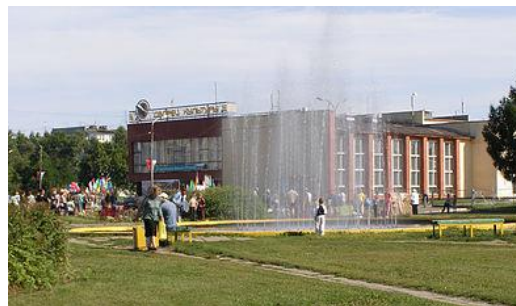
Рисунок 3 – Дворец культуры в р. п. Южный