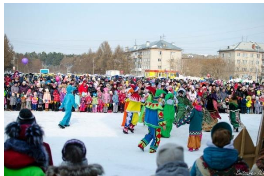
Рисунок 11 – Празднование Масленицы в р.п. Южный

В теплый период времени в будни и выходные дни на площади и аллеях прогуливаются или катаются на велосипедах местные жители. На стадионе проходят тренировки спортсменов и игры на спортивных площадках.