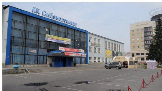
Рисунок 2 – Дворец культуры «Сибэнергомаш»