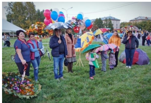
Рисунок 10 – Проведение праздника в р.п. Южный

Среди представленных культурно-досуговых учреждений Дворец культуры в р.п. Южный задействует не только интерьерное пространство, но и открытые площадки на свежем воздухе, которые используются как в теплый, так и в холодный период времени.