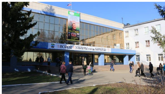
Рисунок 1 – Дворец культуры г. Барнаула

Для изучения архитектурной среды досуговых центров в городе Барнауле были выбраны следующие объекты: Дворец культуры и спорта «Сибэнергомаш», Дворец культуры «Моторостроителей», Дворец культуры города Барнаула и Дворец культуры в рабочем поселке Южный (рисунок 1-4).