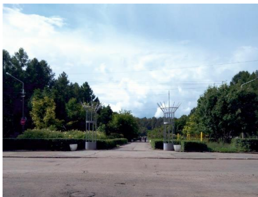
Рисунок 9 – Малые архитектурные формы на территории Дворца культуры р.п. Южный

На площади расположен фонтан и места для отдыха. Входная зона обыгрывается уличными вазонами и флагштоками. Информационная стела располагается вдоль фасада дворца культуры (нерациональное расположение, информация нечитабельна). Архитектурные формы разнообразны, но большинство из них остались с советского периода (рисунок 9).