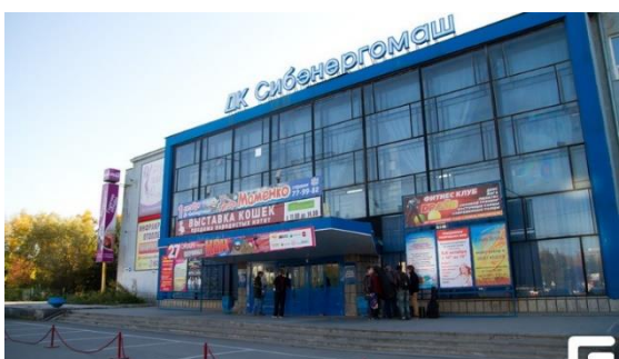
Рисунок 5 – Дворец культуры «Сибэнергомаш»

С момента создания изучаемых объектов, и архитектурно-художественный облик практически не претерпел изменений, но главные фасады таких культурных учреждений, как Дворец культуры и спорта «Сибэнергомаш» (рисунок 5), Дворец культуры «Моторостроителей» поглощены наружной рекламой. Афиши принимают достаточно агрессивный характер, охватывая всё свободное пространство фасадов. Дома культуры просто «растворяются», «утопают» в многообразии изображений и красок [1].