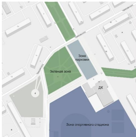
Рисунок 8 – Схема территории Дворца культуры в р.п. Южный

аллеи и спортивный комплекс (рисунок 8). Основной подход к Дворцу культуры осуществляется с двух направлений: с ул. Чайковского и ул. Куйбышева.