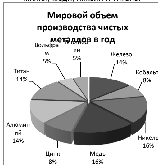
Рисунок 3 - Доля производства порошков чистых металлов

вити. Затраты на производство однородных порошков металлов с высокой степенью чистоты значительно выше, чем на производство оксидов тех же металлов, что связано с дополнительными методами защиты материала от окисления. По объему производства лидируют пять порошков: порошки железа, алюминия, меди, никеля и титана.