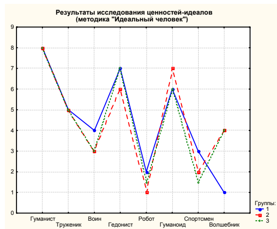
Рис. 1. Группы: 1. Первый класс (46 чел.); 2. Подготовительная группа детского сада (31 чел.); 3. Старшая группа детского сада (12 чел.)

ставлены на рисунке 1. Профили были построены по ранговым значениям ценностей-идеалов.