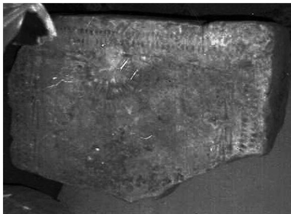
Илл. 2. Середина XVI века. Москва. Нижняя Красносельская ул., двор дома № 44. Верхняя часть белокаменного надгробия

ния села Елохова в середине XVI века и подтверждающий историчность житийных сведений о месте рождения Василия Блаженного. Так как археологические наблюдения на месте находки плит не велись, неизвестно, находились ли они in situ , или же были переотложены. Надгробия были перевезены в музей «Зрелище Москвы» при Эколого-культурном объединении «Слобода». В 2004 году оно прекратило существование [17], а его коллекции были вывезены на свалку.