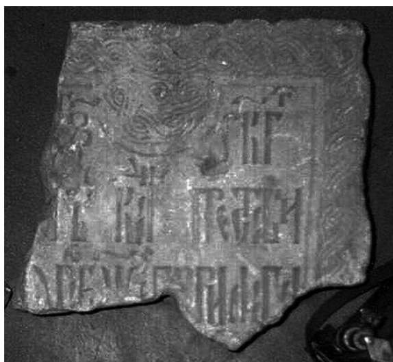
Илл. 3. 1615 год. 21 мая. Москва. Нижняя Красносельская ул., двор дома № 44. Белокаменная надгробная плита Гавриила. Верхняя часть.

букво-тител: ркѣ (стк. 1). Оформление окончаний строк с помощью выносных букв: ра б бже и (стк. 3).