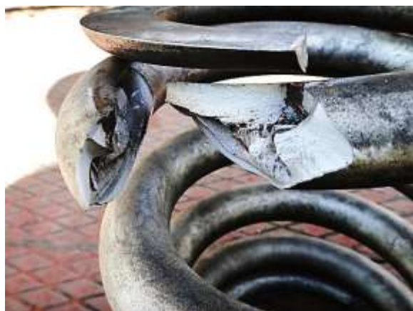
Рисунок 4 – Усталостный излом витков пружин

Исследование строения мартенсита кремнистой пружинной стали показало, что начальные стадии этого процесса контролируется диффузией углерода, но затем контролирующим фактором становится диффузия кремния в \epsilon -карбиде, которая повышает устойчивость \epsilon -карбида и поэтому цементит появляется в кремнистой стали лишь после отпуска при 400 °С, тогда как в углеродистой стали – уже после отпуска при 250 °С.