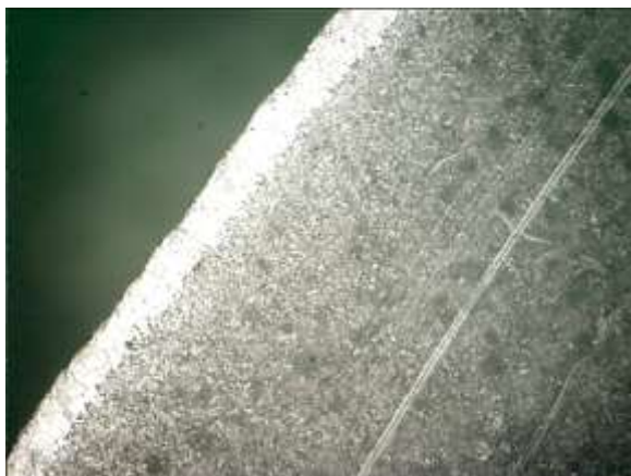
Рисунок 3 – Обезуглероженный слой опорного витка, \times 100

В структуре стали 60С2 после закалки и отпуска при 250–500 °С одновременно присутствуют карбидные фазы: \epsilon , \chi , \text{Fe}_3\text{C} . Максимальное количество \epsilon -карбида отмечается при температуре 350 °С, \chi -карбида – при температуре 400 °С. После отпуска при более высоких температурах преимущественной присутствует цементит ( \text{Fe}_3\text{C} ). Кремний увеличивает устойчивость \epsilon -карбида и стабилизирует структуру мартенсита и остаточного аустенита.