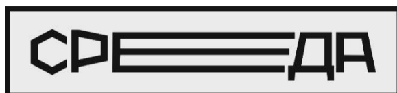
Рисунок 2 – Альтернативное написание эмблемы

Сейчас существует очень большое разнообразие носителей фирменного стиля, специально для этих целей всегда стоит задумываться о необходимости создания динамичных логотипов. Для этого проекта предлагается два дополнительных варианта использования: с удлинением горизонтальных штрихов буквы «Е» (рисунок 2), такой подход позволяет расположить логотип буквально в любой ситуации, в том числе и в углу (рисунок 3), и минималистичный квадратный знак с литерой «С» (рисунок 4).