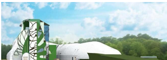
Рисунок 6 – Южный фасад реабилитационного центра

Исходя из выбранной концепции проектирования, было принято решение принять за основу архитектурного стиля бионику. Именно стиль «архитектурная бионика» смог справиться с задачей, которая является неотъемлемой функцией этого стиля, так как не справился бы ни один другой архитектурный стиль. Лаконичность форм, повторяющих элементы природной среды, – основная задача этого стиля (рисунок 6).