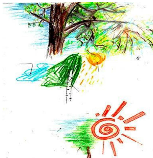
Рисунок 2 – Изображение концепции проектирования. Эскиз, детский рисунок и преобразование рисунка в логотип

именно: Барнаул, Бийск, Горно-Алтайск (рисунок 3-4).