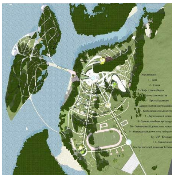
Рисунок 5 – Генеральный план проекта

Анализ генерального плана. Оздоровительный комплекс охватывает немалую прибрежную территорию р. Катунь, имеющую площадь 400 880 м 2 . В связи с тем, что в комплекс включено проектирование туристических объектов, большую роль здесь играет грамотная разработка генерального плана. Схему планирования территории комплекса диктует сама природа – все объекты вписаны в существующую ситуацию. Направляющими линиями для выявления центральной части проекта являются лесополосы, направляющей линией главной аллеи является береговая линия по крайним выступающим её точкам (рисунок 5).