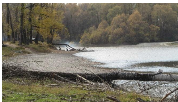
Рисунок 4 – Фотофиксирование прибрежной линии. Северная видовая точка

Анализ генерального плана. Оздоровительный комплекс охватывает немалую прибрежную территорию р. Катунь, имеющую площадь 400 880 м 2 . В связи с тем, что в комплекс включено проектирование туристических объектов, большую роль здесь играет грамотная разработка генерального плана. Схему планирования территории комплекса диктует сама природа – все объекты вписаны в существующую ситуацию. Направляющими линиями для выявления центральной части проекта являются лесополосы, направляющей линией главной аллеи является береговая линия по крайним выступающим её точкам (рисунок 5).