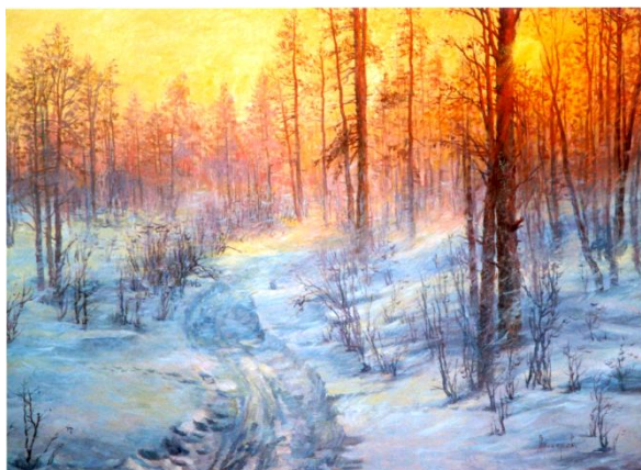
Рисунок 4 – Прохоров С. А. Зимний вечер [1]

«Каждая эпоха нуждается в собственном осмыслении, в собственном понимании самой себя, в собственных эстетических идеалах. Конечно, в этом могут помочь великие и любимые нами произведения, созданные в прошлом. Но объяснить человека новой эпохи может только свежий и нынешний взгляд... Люди будущего не смогут обойтись без художественного осмысления своей сложной и богатой жизни, без создания своей художественной концепции личности и мира. Искусству будущего предстоит решить и совершенно новую задачу» [5].