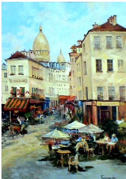
Рисунок 2 – Прохоров С. А. Монмартр [1]

20 ноября 2009 г. в Выставочном зале Алтайской краевой организации Союза художников России состоялось открытие третьей выставки – «Кафедра 3». Эта выставка живописи, рисунка и скульптуры проходила в международном формате, поскольку к участию в ней были приглашены преподаватели кафедры изобразительных искусств Ховдского государственного университета.