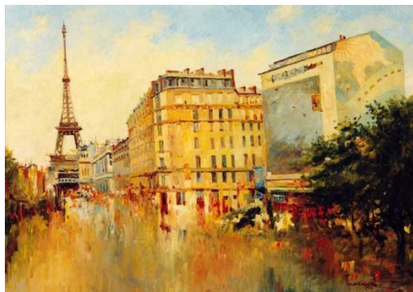
Рисунок 1 – Прохоров С. А. Париж после дождя [1]

Все преподаватели кафедры – специалисты высокого уровня, получившие хорошее академическое художественное образование, обладающие большими творческими возможностями, имеющие весомый педагогический опыт. Их специализация довольно широка: это и графика, и живопись, и скульптура, и монументальное искусство. Они участники международных, зарубежных, республиканских, региональных, краевых, городских и многих других выставок.