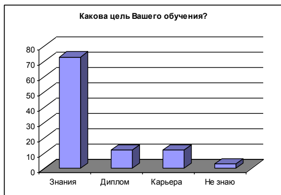
Рисунок 4 – Ответы на вопрос №4 анкеты