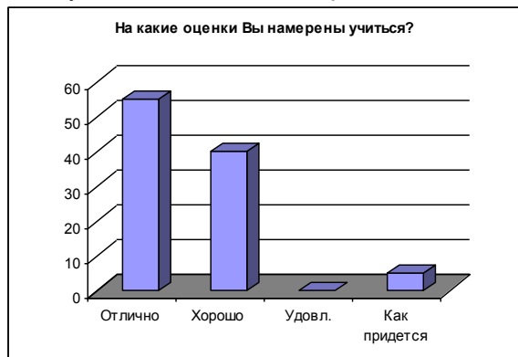
Рисунок 6 – Ответы на вопрос №6 анкеты