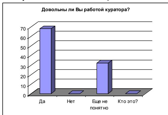
Рисунок 5 – Ответы на вопрос №5 анкеты