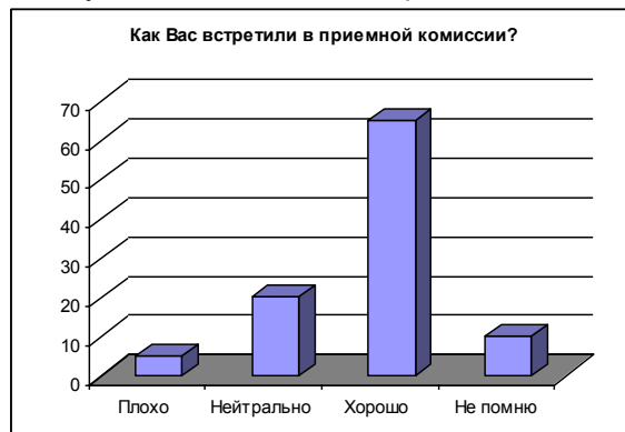
Рисунок 2 – Ответы на вопрос №2 анкеты