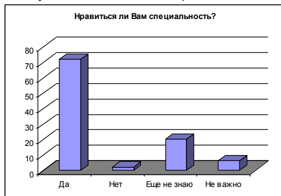
Рисунок 3 – Ответы на вопрос №3 анкеты