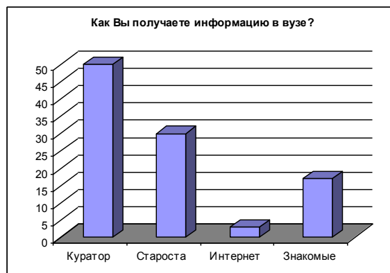
Рисунок 8 – Ответы на вопрос №8 анкеты