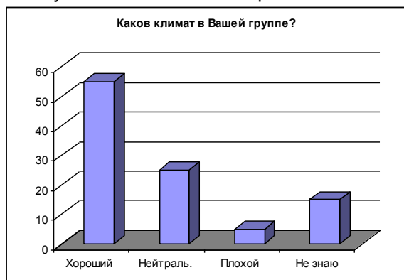
Рисунок 7 – Ответы на вопрос №7 анкеты

Как видно из представленных результатов большинство студентов первого курса узнали о выбранной специальности из глобальной сети Интернет, выбранная специальность им нравится, будущих студентов хорошо встретили в приемной комиссии. Почти 70% опрошенных пришли получать новые знания и практически все намерены учиться только на «хорошо» и «отлично». Многие студенты первого курса довольны работой кураторов, некоторые пока еще не оценили этого, однако, все из них познакомились с куратором и начали работать вместе. При этом лишь 4% респондентов отметили, что климат в их группе плохой. Основным источником информации для студенческой группы является староста и куратор. Основными сложностями первых дней пребывания в группе для большинства опрошенных является незнание имен одногруппников и путаница в расположении корпусов АлтГТУ.